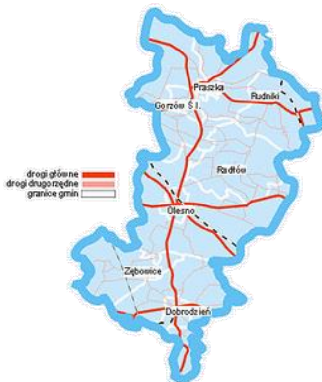
Rysunek 1. Sieć dróg krajowych i wojewódzkich na terenie powiatu oleskiego

Przez teren powiatu oleskiego przebiegają drogi krajowe (nr 11, 42, 43, 45, 46) oraz wojewódzkie (nr 487, 494, 901).