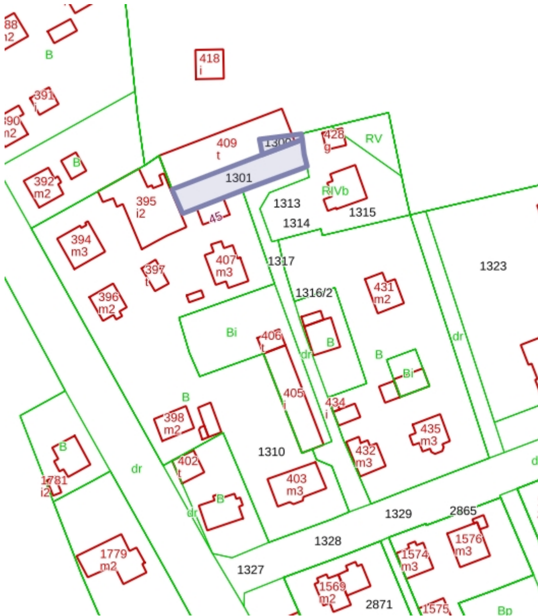
Rysunek 3 Działki nr 1300, 1301 własność Gmina Olesno