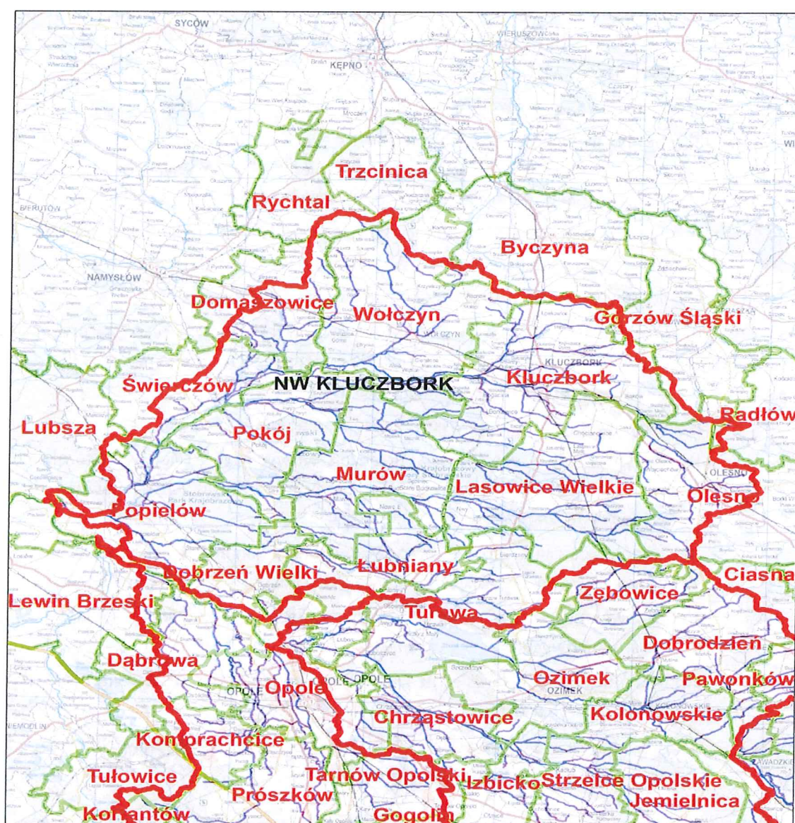
Mapa z terenu działania NW w Kluczborku.

Legenda ESRIDATA_SDE_GL_NW_poly_2017_12_07 ESRIDATA_SDE_gminy_2017 Cieki Wyróżniono_gl_2017